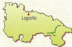
..... Vías Verdes del Cidacos y Préjano