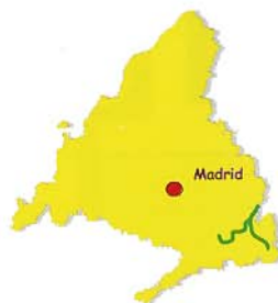
Vía Verde del Tajuña y Vía Verde del Tren de los 40 Días