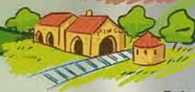
Estació del Pinell de Brai