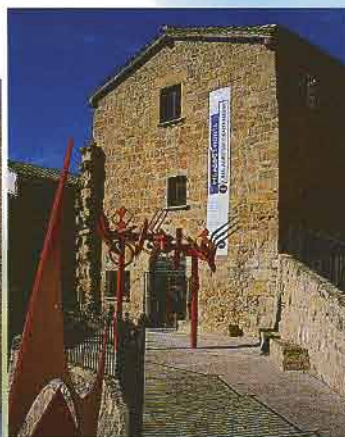
HORTA DE SANT JOAN