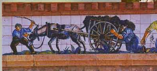
EL PINELL DE BRAI

Après Bot, cet itinéraire pénètre dans les montagnes de Pàndols et de Cavalls où l'on peut admirer d'impressionnantes parois rocheuses escarpées, idéales pour la pratique de l'escalade et de la randonnée.