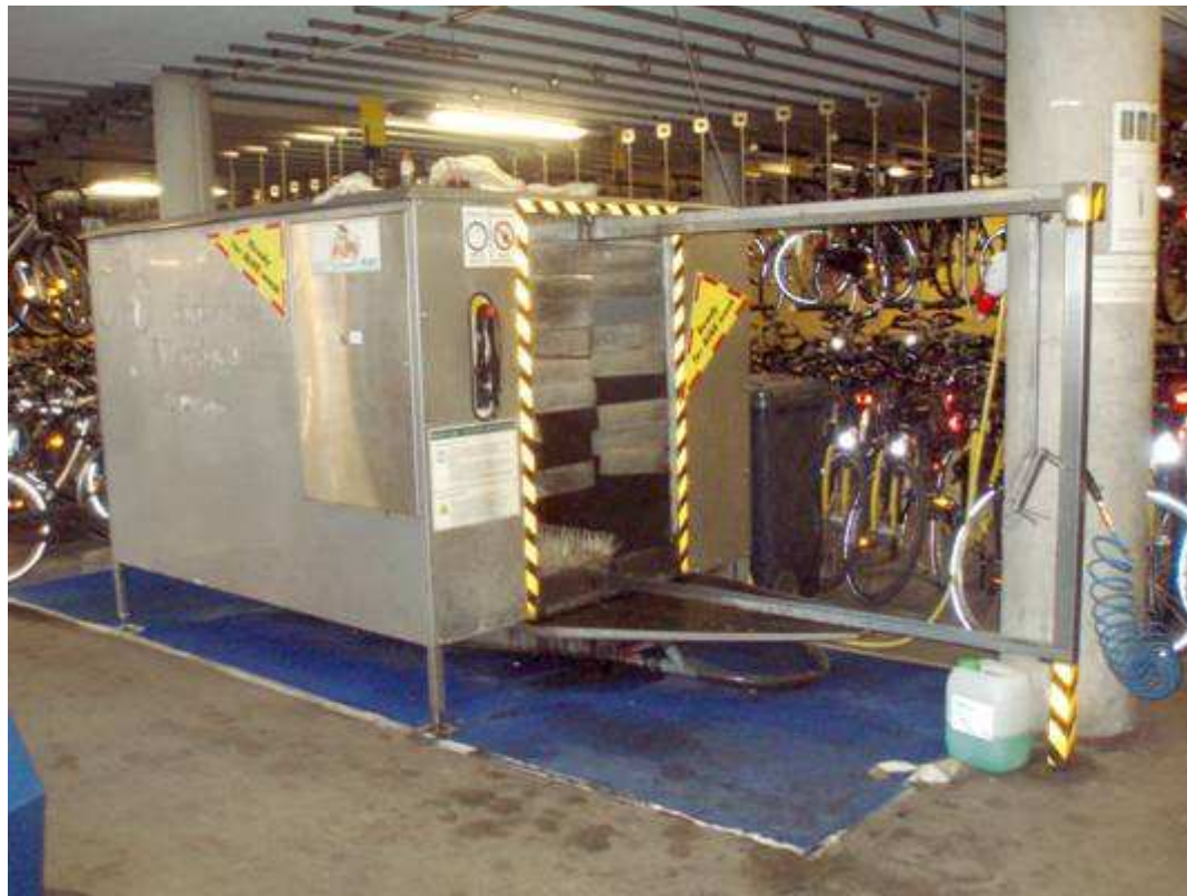
Servicio de lavado de bicicletas en el aparcamiento de la estación de tren de Munster