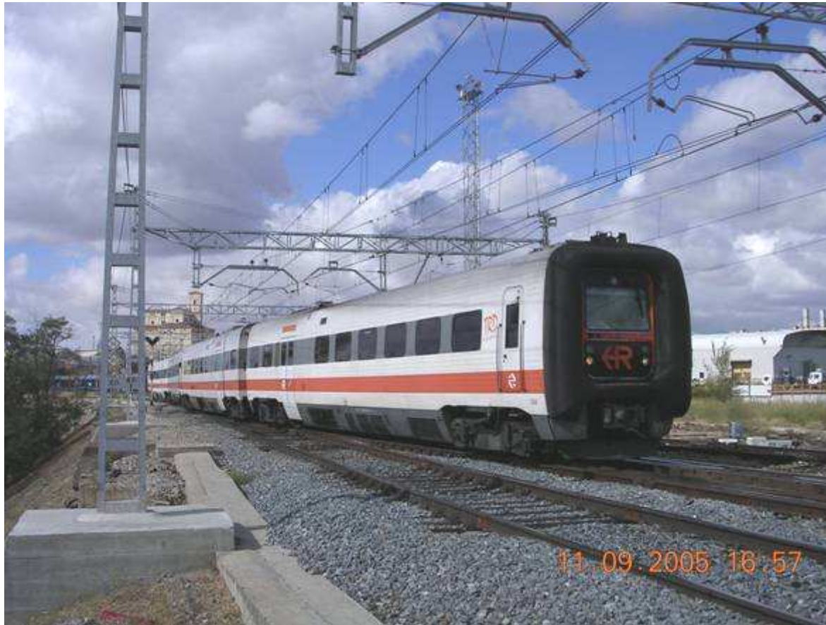
SERIE 594 (TRD)

Sin embargo, los ciclistas encontramos serios problemas a la hora de llevar nuestras bicicletas en estos medios de transporte