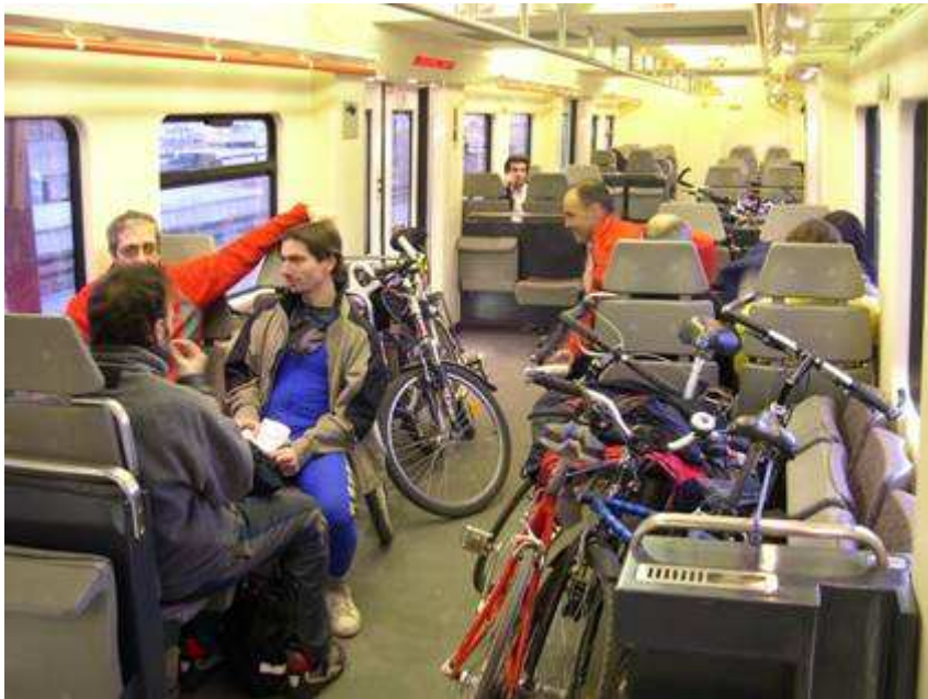
En asientos abatibles