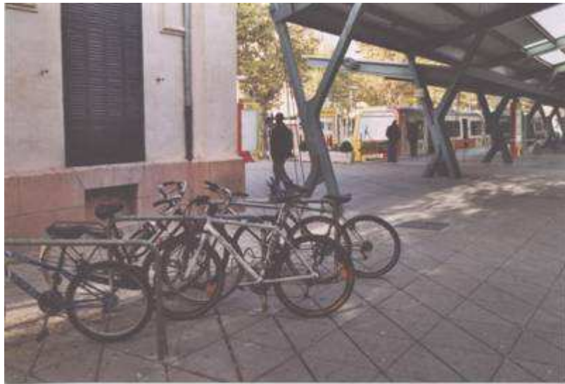
Estación de tren de Palma de Mallorca