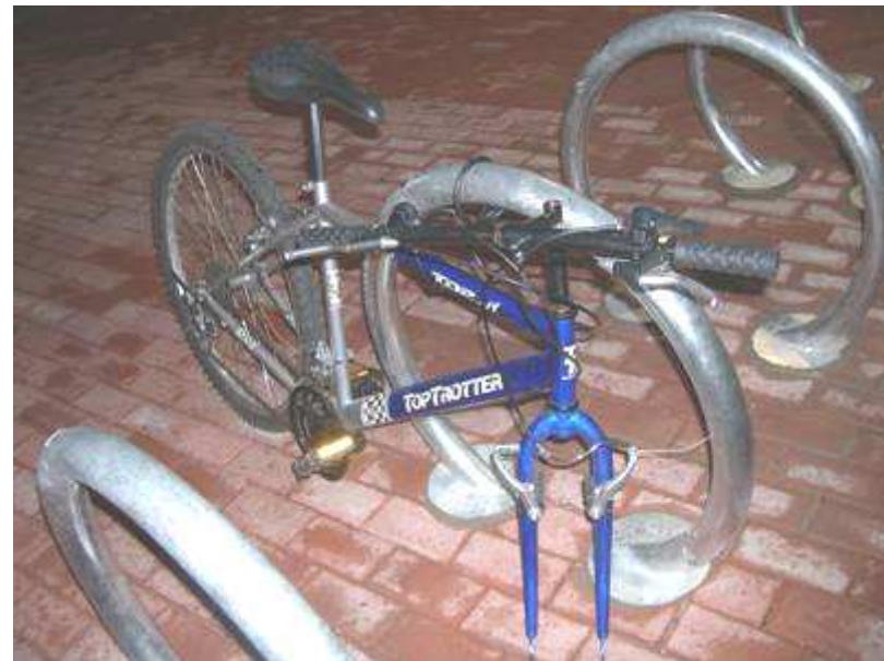
Robos por una incorrecta ubicación