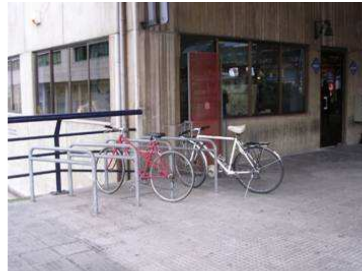
Estación de Cercanías de Gijón

Los aparcamientos deben estar preferentemente localizados en el interior de los recintos del ferrocarril