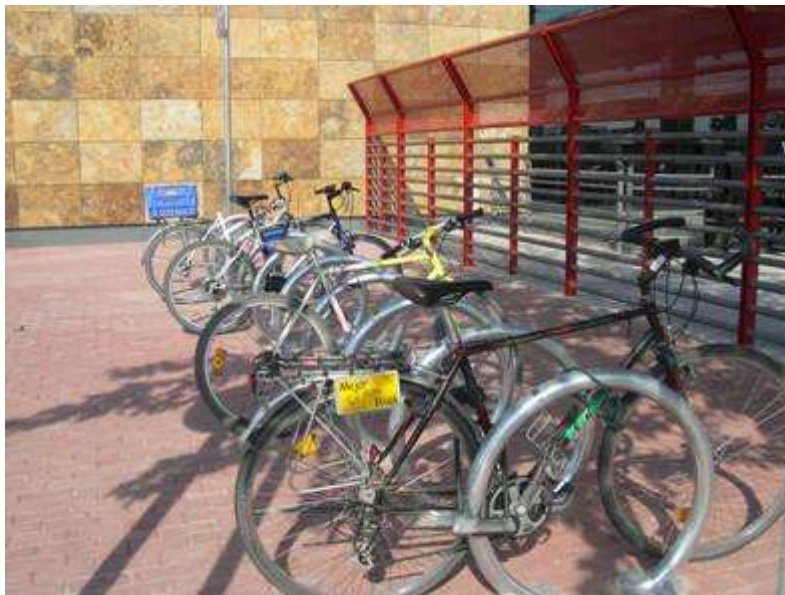
Estación de Cercanías de Azuqueca de Henares