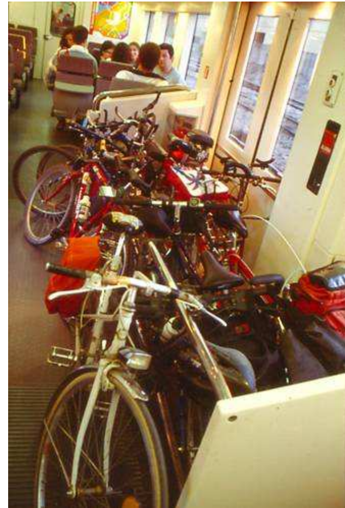
En puertas que no se abren