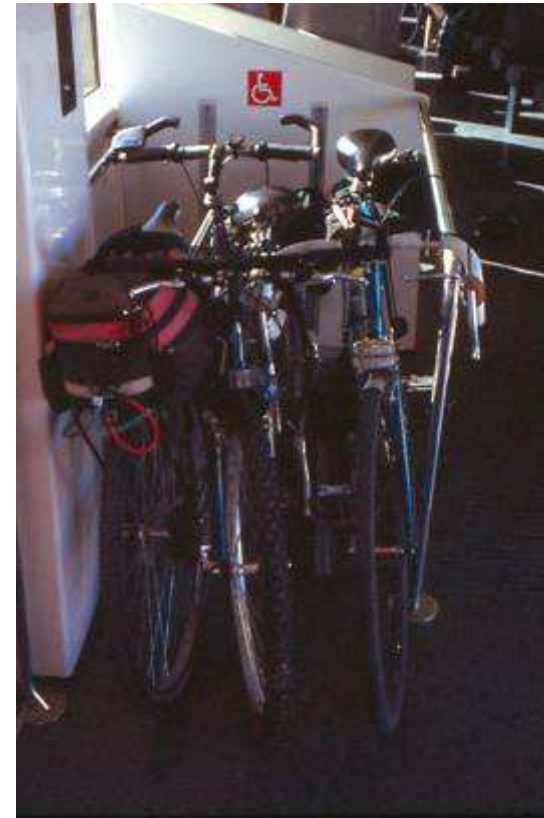
Espacios multimodales con determinación de preferencias