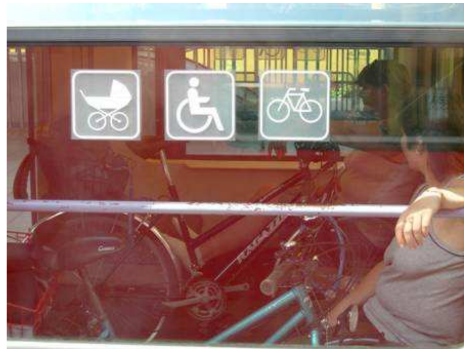
Más completo y claro