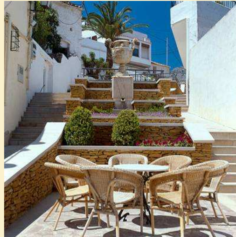
Remodelación c/ San José. Casco Antiguo Oropesa