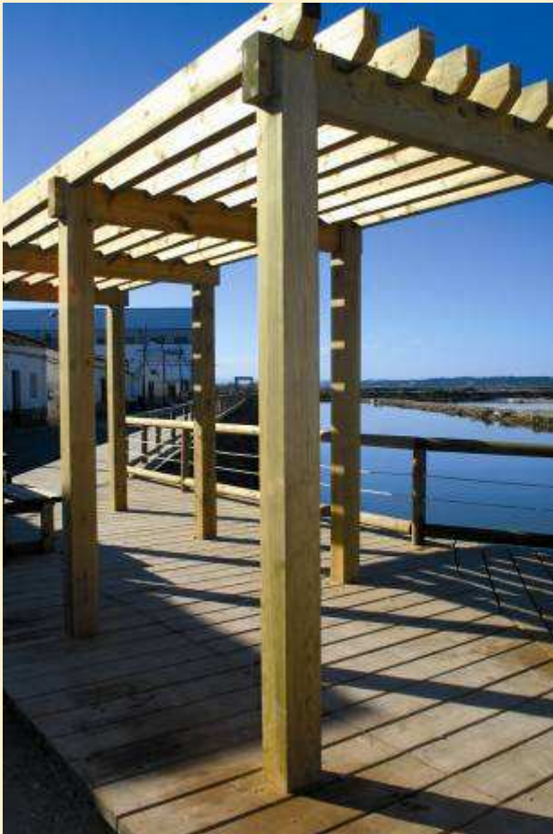
Nuevo mirador del Paseo de las Salinas. Isla Cristina