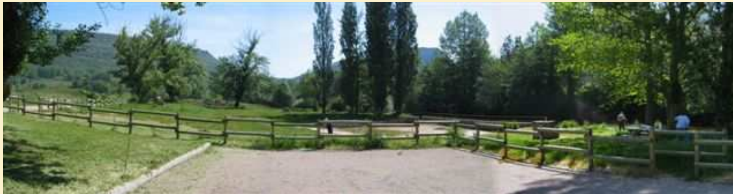
Parque de Ribera y Baño en San Martín. Campoo los Valles