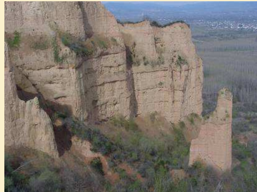
Paraje de las Barrancas. Las Médulas