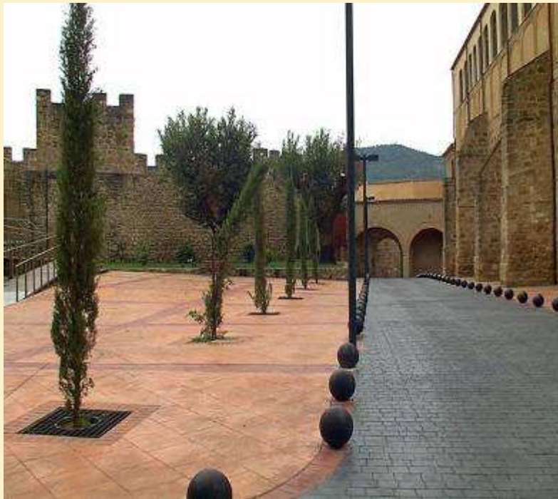
Actuaciones en la muralla medieval. Olivenza