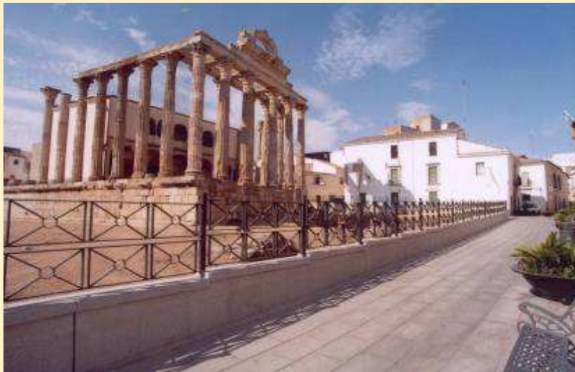
Embellimiento del casco histórico, Templo de Diana. Mérida