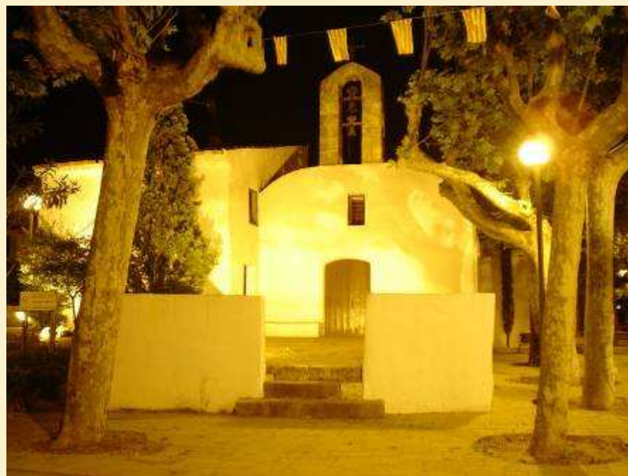
Iluminación artística de la Ermita de Sant Salvador. El Vendrell