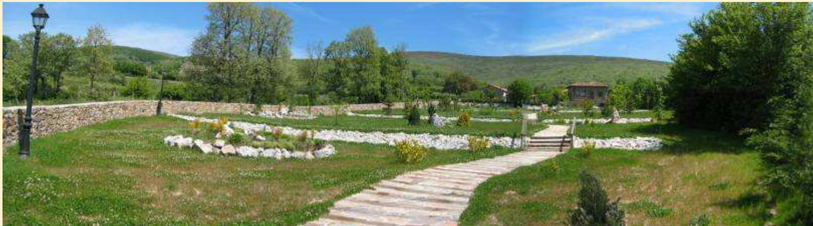
Parque en Arroyal. Campoo los Valles