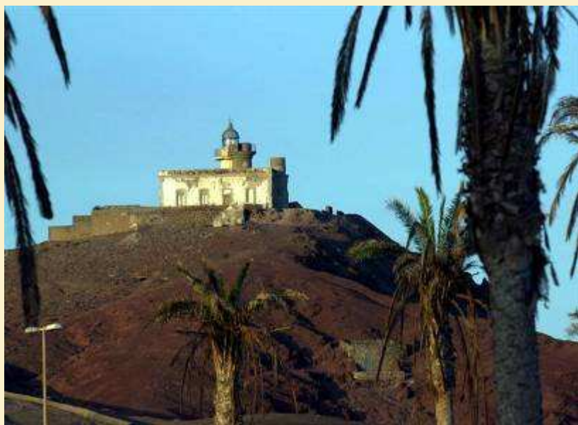
Faro de Arinaga. Agüimes