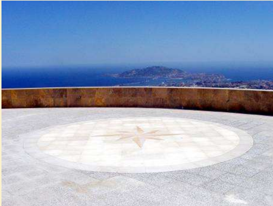
Mirador de Isabel II. Ceuta