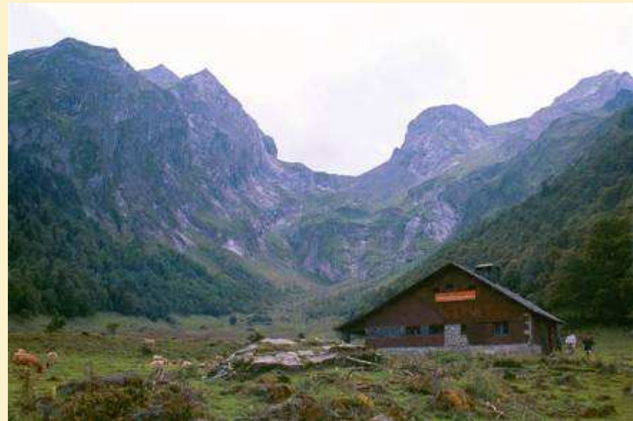
Refugio Artiga de Lin. Valle de Arán