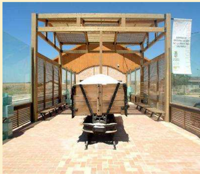
Centro de interpretación dedicado a la Industria salinera. Torrevieja