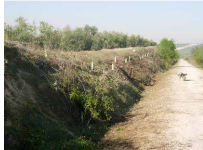
Las Navas del Selpillar (Lucena)

VÍAS VERDES DE CÓRDOBA Programa de Fomento de Empleo Agrario