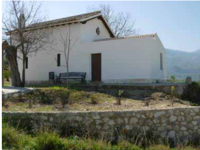
Cruz Blanca (Zuheros)