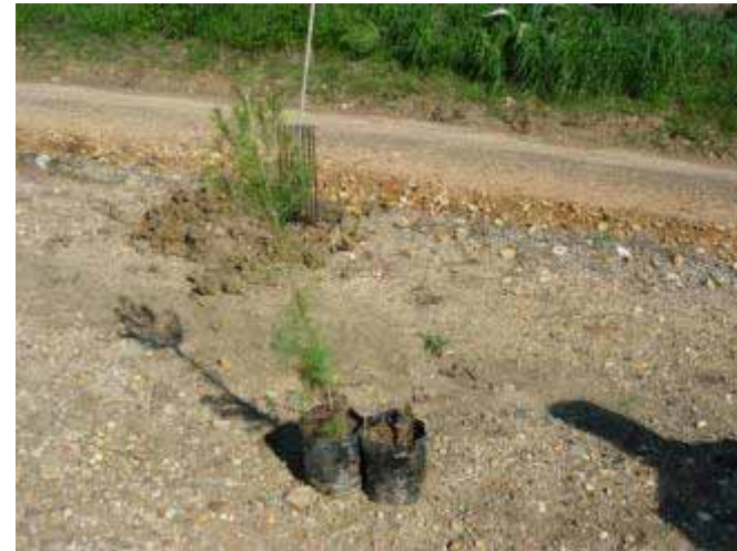
Materiales de repoblación

VÍAS VERDES DE CÓRDOBA Programa de Fomento de Empleo Agrario